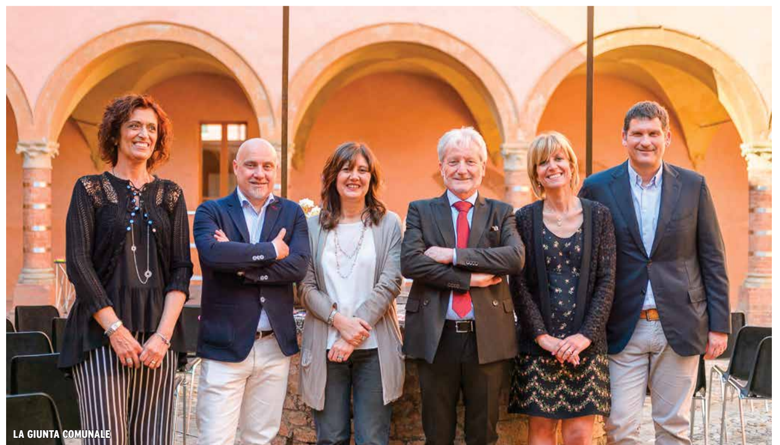
LA GIUNTA COMUNALE

Lorenzo Pellegatti Sindaco di San Giovanni in Persiceto