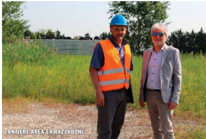
CANTIERE AREA EX RAZZABONI

In ambito di urbanistica abbiamo pubblicato un avviso pubblico di invito a presentare proposte per l'attuazione del Psc vigente tramite accordi operativi mirati alla riqualificazione, espansione e rigenerazione urbana, che si è poi tradotto nell'approvazione di nuovi indirizzi. Rispetto alle previsioni del Piano Strutturale Comunale ideato dalle precedenti Giunte, nell'intera San Giovanni in Persiceto passeremo dai 187 ettari di espansione residenziale prevista ai 115 ettari e dai 5.340 alloggi previsti a circa la metà, cioè a 2.395 potenziali (i dati attuali sono calcolati in base alle manifestazioni d'interesse). Abbiamo poi proceduto con una