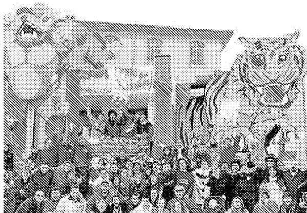
La società carnevalesca 'Brot e cativ'