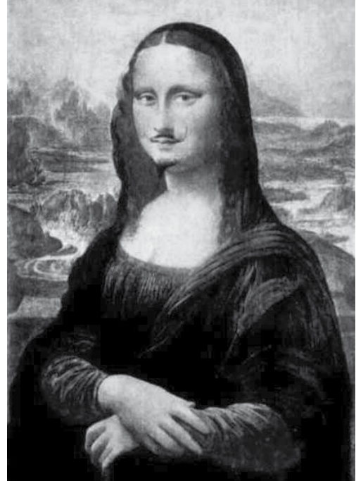
"L.H.O.O.Q." di Marcel Duchamp

Conduce incontri individuali e di gruppo per lo sviluppo e la crescita personale e professionale su comunicazione interpersonale, empowerment e competenze relazionali, gestione degli impatti emotivi e attivazione di programmi di consapevolezza ed auto-cura.