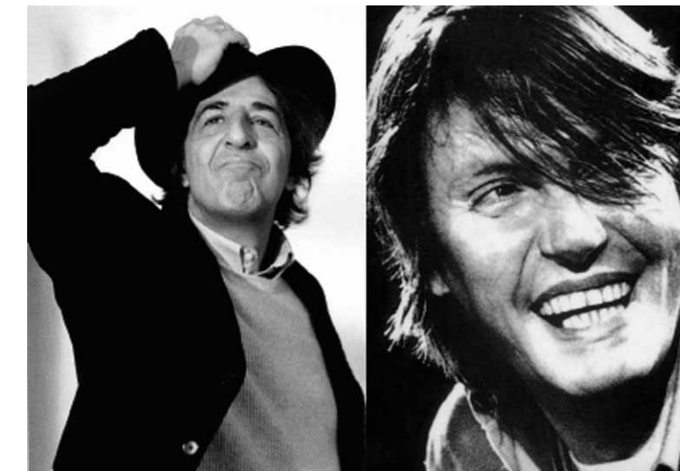
Giorgio Gaber (Milano 1939 - Montemagno di Camaiore 2003) Fabrizio De André (Genova 1940 - Milano 1999)

Per quanto voi vi crediate assolti siete per sempre coinvolti Fabrizio De André , Canzone del maggio