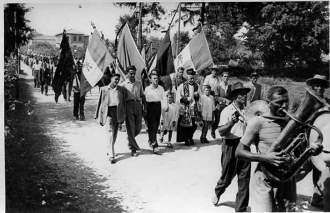
Festa della Liberazione di Anzola - Anni '50

email: biblioteca@anzola.provincia.bologna.it