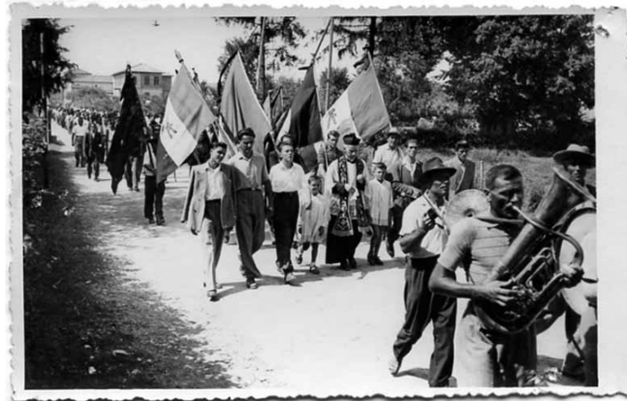
Festa della Liberazione di Anzola - Anni '50

Per informazioni: tel. 051 6502222 email: biblioteca@anzola.provincia.bologna.it