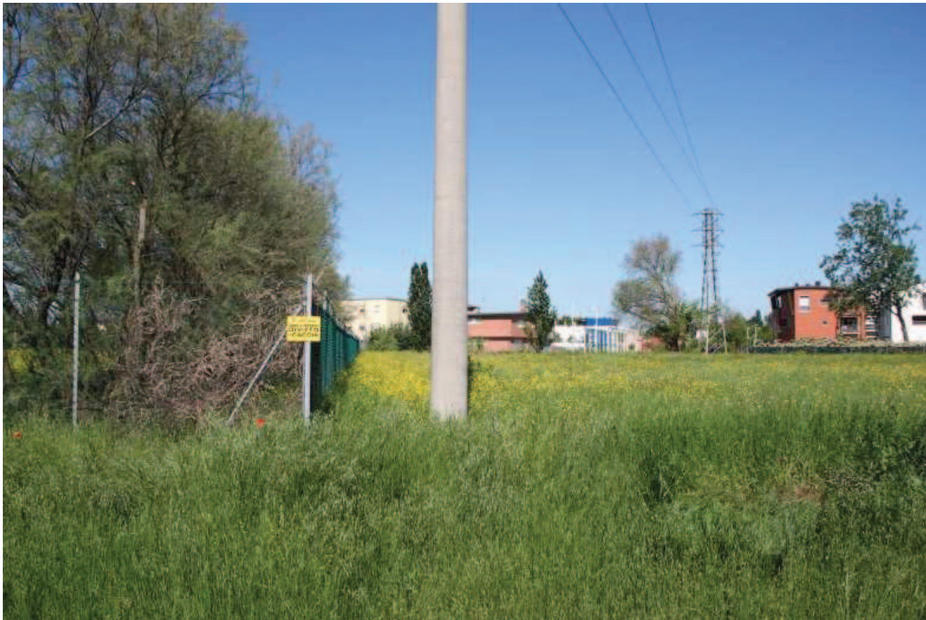
FOTO 3 - Esterno – vista del confine con l'impianto accumulatore dell'acqua potabile – lato sud